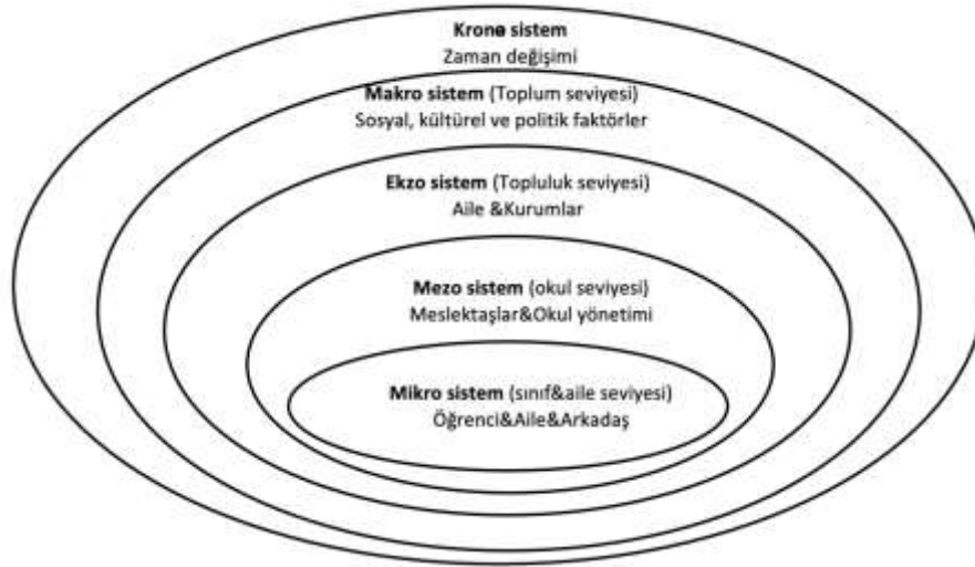
Şekil 1. Bronfenbrenner'ın (2005) Ekolojik Çerçevesinden Geliştirilen Öğretmen-Çevre Etkileşimi (Cross ve Hong, 2012)

Benzer biçimde Cross ve Hong (2012) da Bronfenbrenner'ın (2005) ekolojik çerçevesinden yola çıkarak öğretmenlerin çevre ile nasıl etkileşime geçip duygularını oluşturduğunu Şekil 1'de görüldüğü biçimde kavramsallaştırmıştır. Cross ve Hong'un (2012) çerçevesine göre duygular mikro sistem, mezo sistem, ekzo sistem, makro sistem ve krono sistem olarak adlandırılan içiçe geçmiş sistemlerdeki etkileşimle ortaya çıkmaktadır.